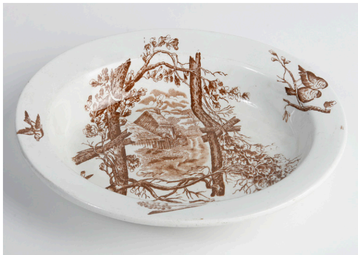
Fuente. Loza blanca con estampación calcográfica.