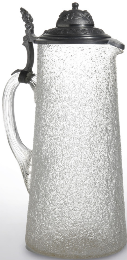
Jarra. Vidrio escarchado.