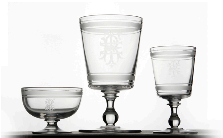
Servicio de mesa. Copas. Vidrio grabado.