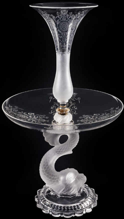
Centro de mesa "Delfin". Vidrio grabado y deslustrado.