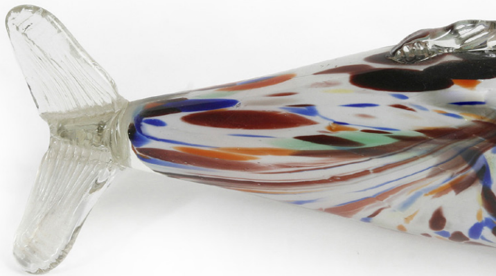
Pez. Pieza de "la fresca".