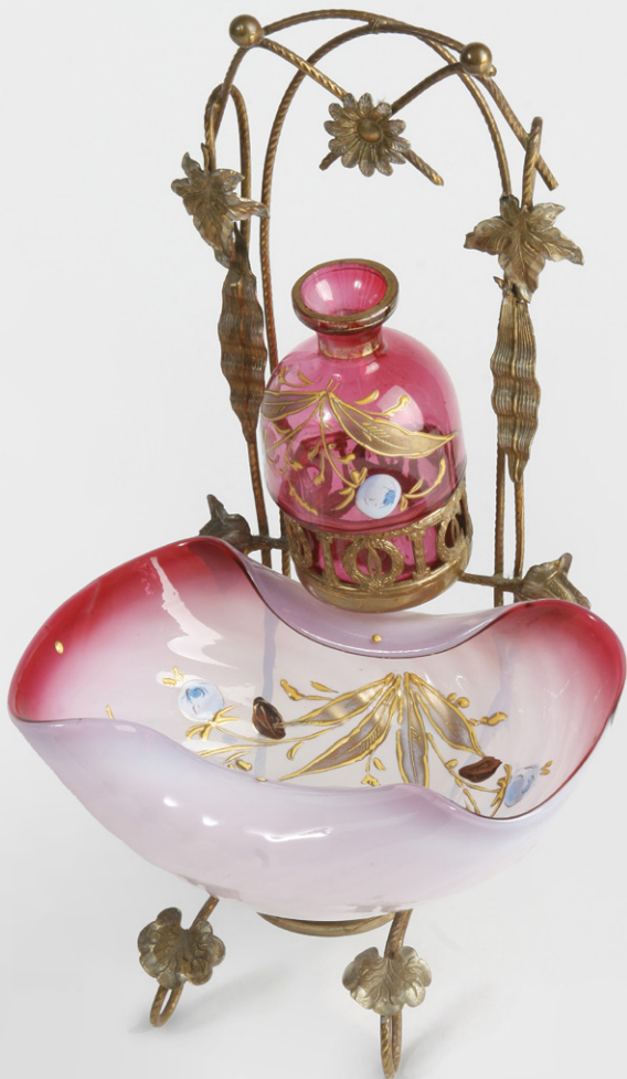
Joyero. Vidrio y opalina decorada.