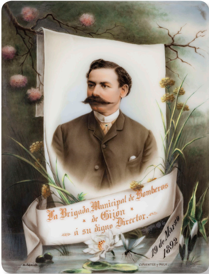
Placa de opalina con retrato. Firmada por Milius Schmidt.