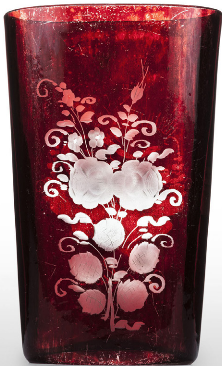
Vaso de viaje. Vidrio grabado a la rueda.