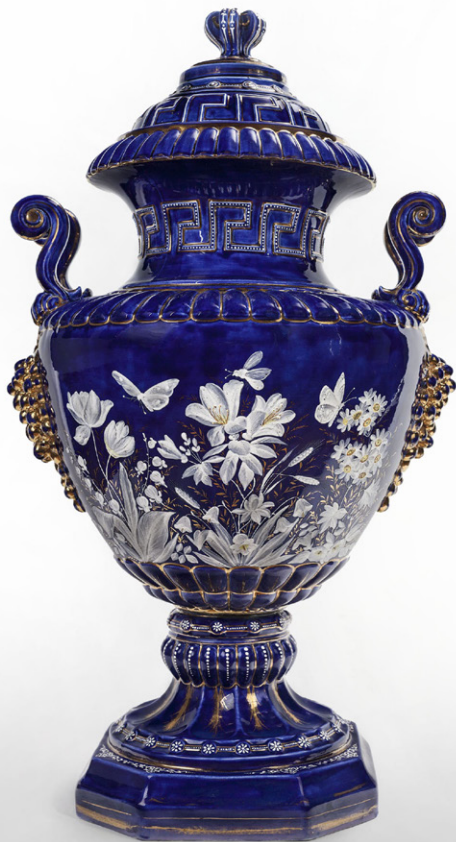
Jarrón. Loza esmaltada y dorada.