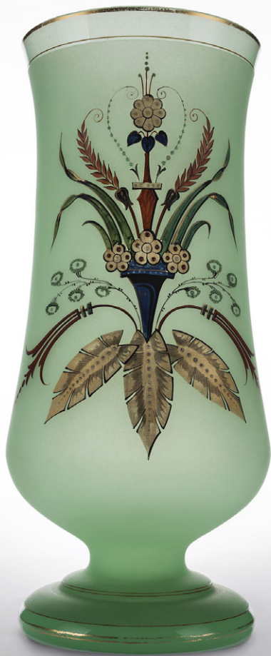
Jarrón. Opalina decorada por Arturo Truan.