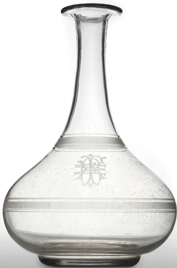
Servicio de mesa. Botella. Vidrio grabado.