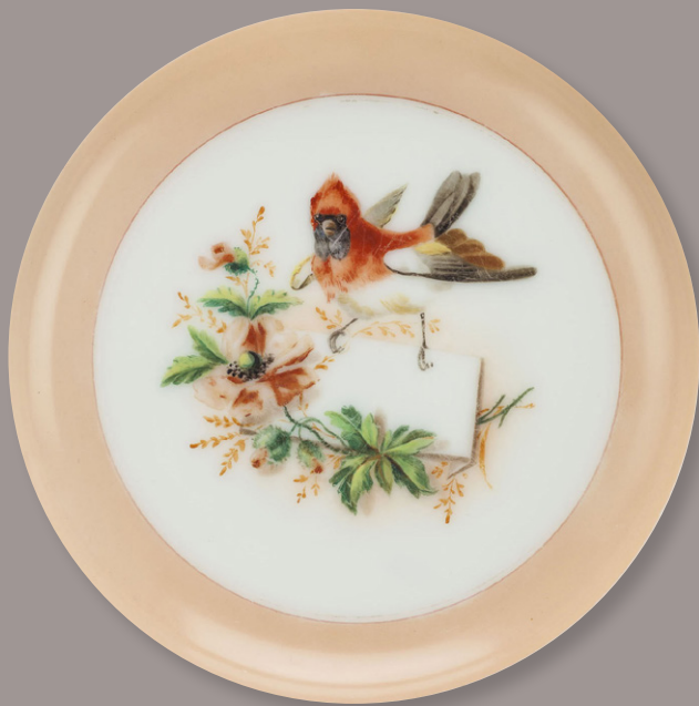
Plato. Opalina pintada.