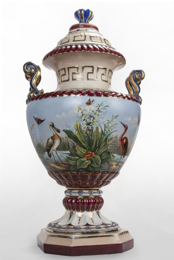
Jarrón. Loza pintada.