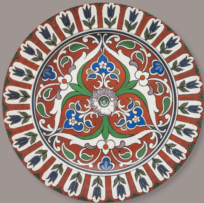
Plato. Loza pintada. Firmado por Enrique Weber.