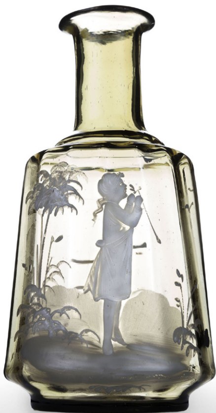
Botella de noche. Vidrio con decoración esmaltada.