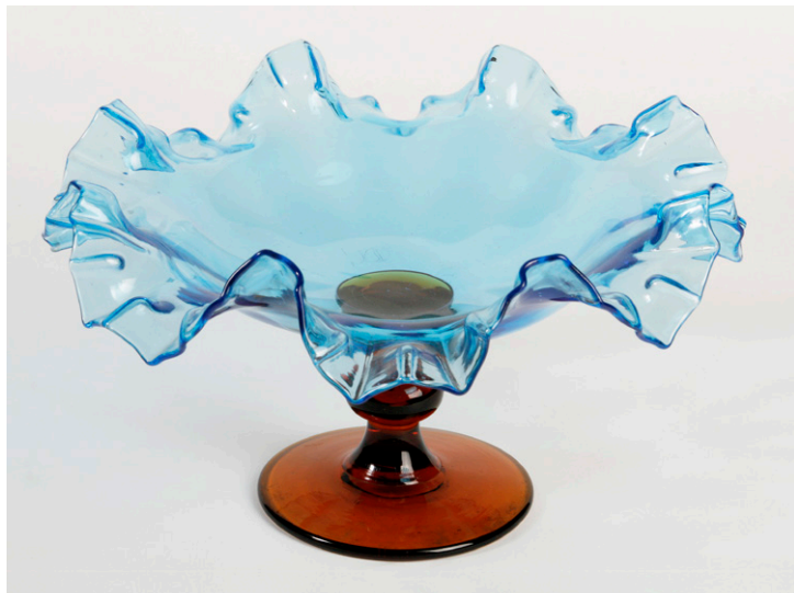
Frutero. Vidrio azul y amelado

Ahora no cabe recordar de nuevo la historia de ambas fábricas, sino ante las piezas seleccionadas para esta muestra, hacer recapitulación de la labor artística desarrollada y su expansión a través de otras fábricas y talleres decorativos impulsados por antiguos trabajadores.