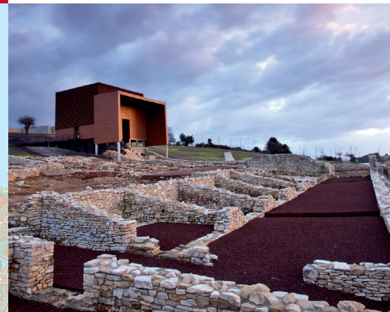
Detalle de los restos arqueológicos de la villa