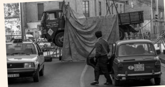
Camión colgado de una grúa durante las movilizaciones de Naval Gijón de 1988