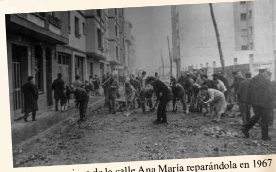
Vecinas y vecinos de la calle Ana María reparándola en 1967

Es este un recorrido que iniciamos a finales del siglo XIX, continuamos en la clandestinidad de la dictadura franquista y finalizamos en los albores del siglo XXI. Desde que la industria llega a Gijón/Xixón, en un lento proceso comienza a consolidarse una conciencia de clase entre las y los trabajadores, germen del movimiento obrero que daría paso a la aparición de