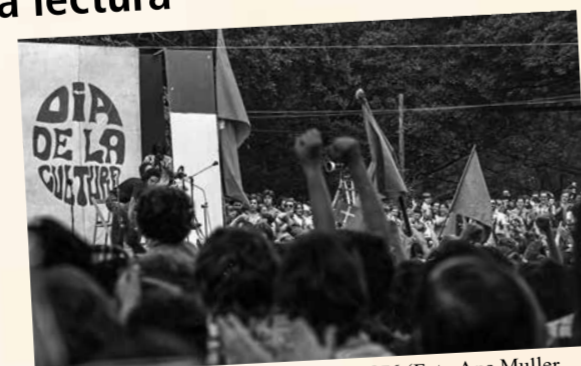
Celebración del Día de la Cultura en 1976

Durante el franquismo, esquivando las leyes que prohibían el asociacionismo, surgen diversas Sociedades Culturales como continuadoras del espíritu de los ateneos: Gesto (1965), Natahoyo (1966), Pumarín (1967) o Gijonesa (1968). Además de fomentar la cultura, fueron lugares donde hablar y debatir sobre política y acrecentar las