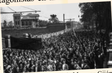
Manifestación del 1º de Mayo en Gijón/Xixón en 1936 (Foto Constantino Suárez. Muséu del Pueblu d'Asturies. Sig. FF004547)

Tras la guerra y en plena dictadura, esa masa social trabajadora, a pesar de la dura represión ejercida sobre ella, siempre se mantuvo latente y, en 1957, comienza una huelga en la mina de La Camocha; es aquí donde se considera que nacen las Comisiones Obreras, germen de un sindicato que no sería legalizado hasta 1977.