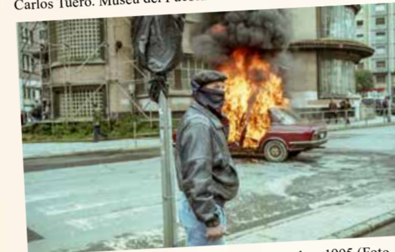
Barricada de los trabajadores del sector naval en 1995

Las mejoras laborales en cuestiones como los salarios, la seguridad, los horarios o los derechos se consiguieron en la calle, en las reivindicaciones de la clase trabajadora que, una vez dados los primeros pasos hacia una conciencia de clase, entendieron que unidos eran más fuertes. Así ocurrió en la primera huelga general de Gijón/Xixón, en 1872, o en la de 1901 que, aunque fue un fracaso, marcaría el camino a seguir en acciones futuras.