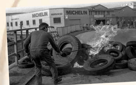
Movilizaciones de Talleres de Moreda en 1984

La solidaridad es una de las claves de la victoria