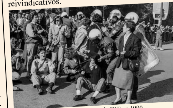
Manifestación de las trabajadoras de IKE en 1990 (Foto José Véliz. Muséu del Pueblu d'Asturies. Sig. FF050786_0501)

En plena dictadura, mujeres que habitaban en los polígonos y barrios obreros de Gijón/Xixón, encabezaron diversas movilizaciones reclamando mejoras en los mismos. Y durante la reconversión industrial, las trabajadoras de la industria textil fueron un ejemplo de lucha obrera por la defensa, ya no solo de sus puestos de trabajo, sino por la dignidad en las condiciones laborales, sumándose a los conflictos de sus compañeros de los astilleros como unas más. A pesar del papel secundario impuesto por los empresarios en sus fábricas, las mujeres de Obrol o de Ike estuvieron a la vanguardia. El inicio de la mujer se visibilizase; ya no eran "sólo" mujeres, se convirtieron en sujetos políticos, sindicales y reivindicativos.