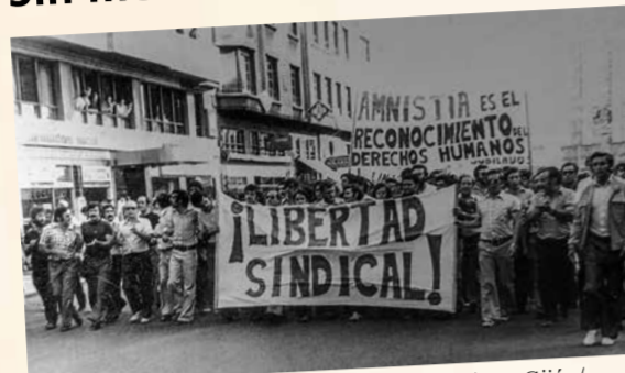
Manifestación por la libertad sindical celebrada en Gijón/Xixón en 1976

Sin memoria, estamos abocados a perder nuestra identidad