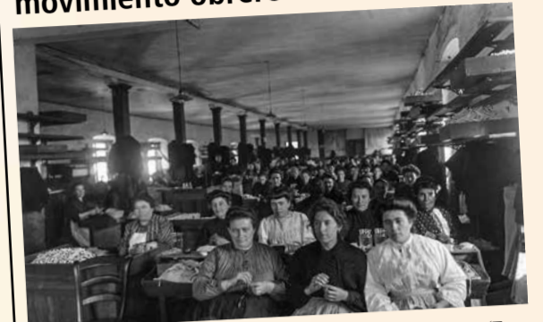
Cigarreras en la Fábrica de Tabaco de Gijón/Xixón en 1909 (Sig. 25556)

Las mujeres en la vanguardia del movimiento obrero