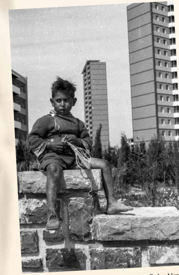
Polígono de las Mil Quinientas hacia 1960

En los barrios obreros la conciencia de clase se asentó de manera definitiva