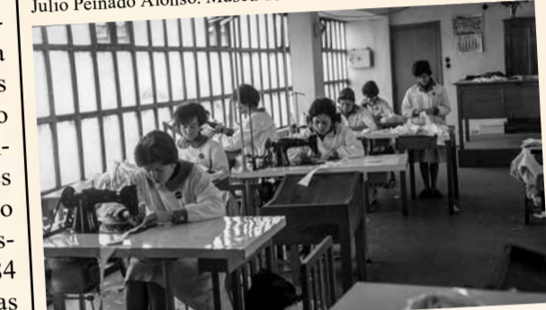
Mujeres trabajando en la fábrica de camisas SINCOS en 1965

Casi invisibilizadas, el papel de las mujeres fue, sin embargo, muy importante, estando a la vanguardia de la lucha por los valores democráticos y de la clase trabajadora. Les cigarreras , las mujeres que trabajaban en la Fábrica de Tabacos de Gijón/Xixón, marcarían el camino; en 1903 encabezaron la primera gran huelga de Asturias protagonizada por mujeres. Supuso un punto de inflexión que hizo ver a otras trabajadoras que unidas podrían conseguir mejoras en sus condiciones laborales.