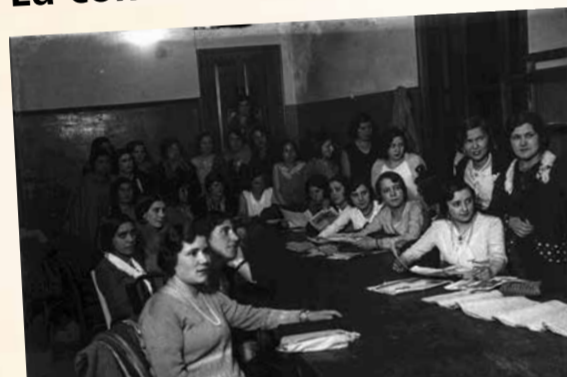
Mujeres durante una clase nocturna del Ateneo Obrero en 1928 (Foto Constantino Suárez. Muséu del Pueblu d'Asturies. Sig. FF001447)

La concienciación comienza por la educación