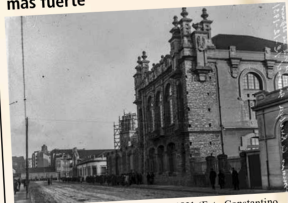
Casa del Pueblo de Gijón/Xixón en 1931 (Foto Constantino Suárez. Muséu del Pueblu d'Asturies. Sig. FF001430)

La clase trabajadora unida se hace más fuerte